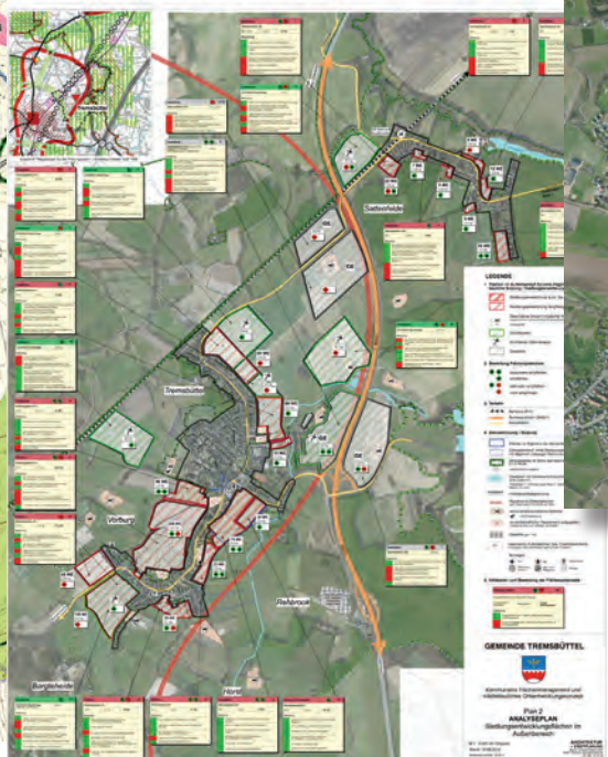
Analyse Siedlungsentwicklungsflächen im Außenbereich

Gemeinde Tremsbüttel Kommunales Flächenmanagement und städtebauliches Ortsentwicklungskonzept Erläuterungsbericht