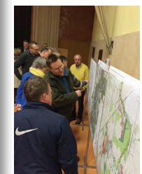
Bürgerwerkstatt Februar 2015